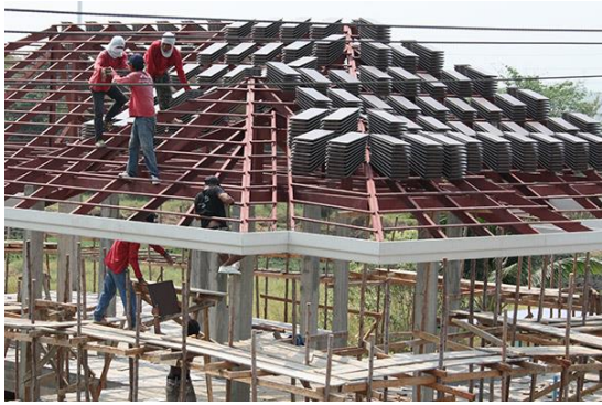
ภาพคนงานก่อสร้าง