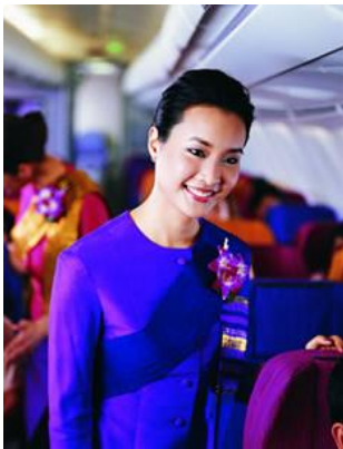
(Kinnaree December 2006)