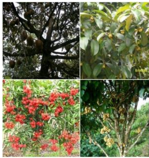
ภาพสวนผลไม้หน้าชนิด