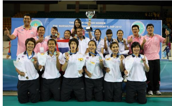
ภาพนักกีฬาได้รับถ้วยรางวัล