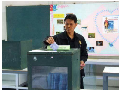
ภาพการใช้สิทธิเลือกตั้ง