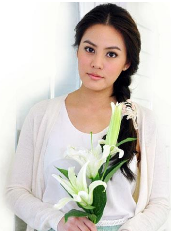
ภาพหญิงสาว