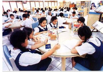
ภาพนักเรียนกำลังอ่านหนังสือ