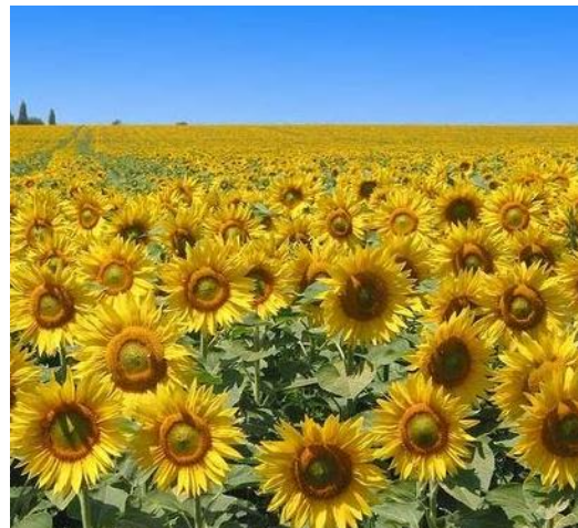
ภาพดอกไม้

ที่มา : ภาพที่ 1 http://baby.kapook.com/photo/baby_21804.html