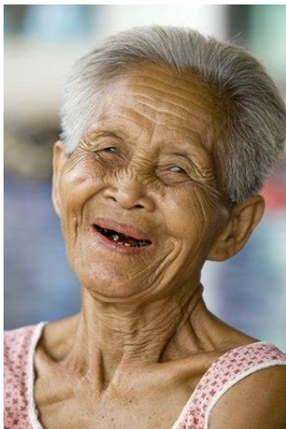
ภาพคนแก่