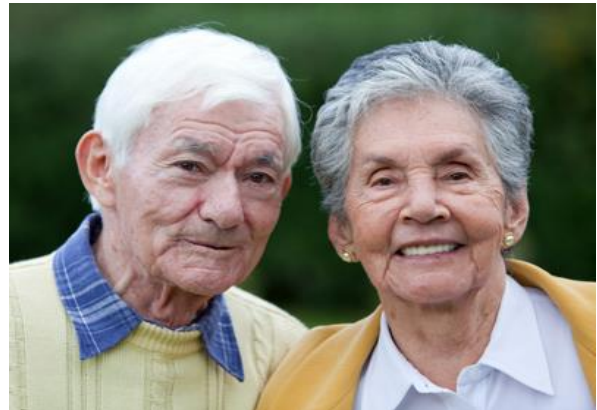
ภาพคนชรา