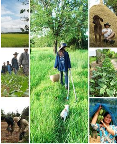
ภาพไร่นาสวนผสม