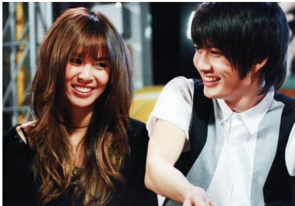
ภาพวัยรุ่นหญิงและชาย