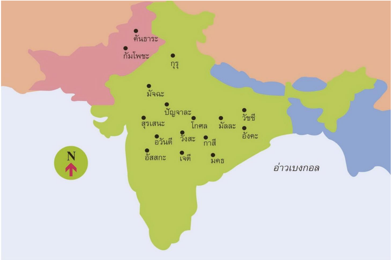
แผนที่แสดงแคว้นใหญ่ต่างๆ ในชมพูทวีปสมัยพุทธกาล