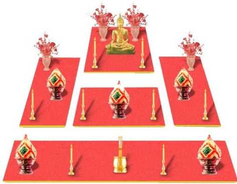
ภาพโต๊ะหมู่ 5