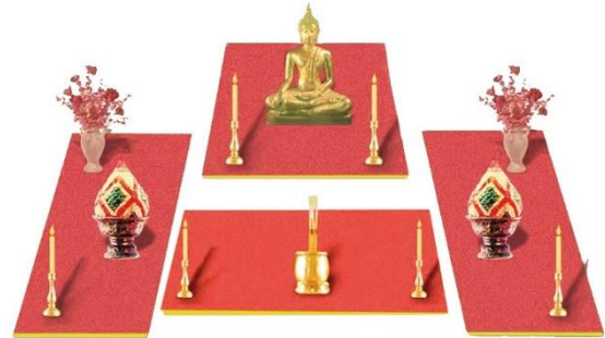
ภาพโต๊ะหมู่ 4