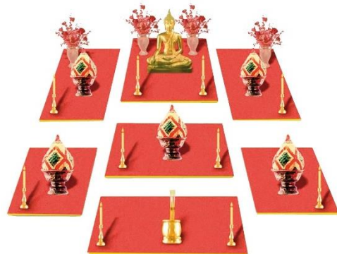
ภาพโต๊ะหมู่ 7