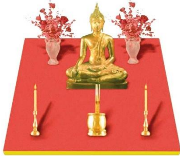
ภาพโต๊ะเดี่ยว