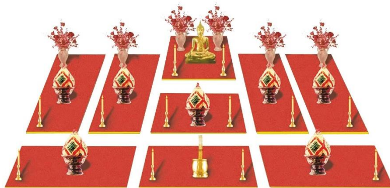
ภาพโต๊ะหมู่ 9