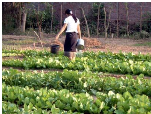
ภาพชาวสวนกำลังรดน้ำแปลงผัก

ที่มา : ภาพที่ 1 วิทย์ วิศทเวทย์ และเสฐียรพงศ์ วรรณปก. 2552. หนังสือเรียน รายวิชาพื้นฐาน พระพุทธศาสนา ม.1.