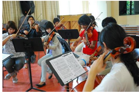
ภาพนักดนตรีกำลังเล่นดนตรี