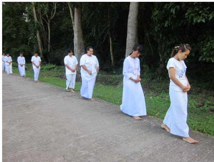
ภาพการเดินจงกรม