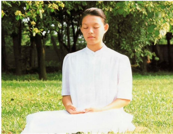
ภาพการนั่งสมาธิ