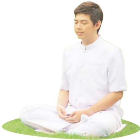
ภาพการนั่งสมาธิ