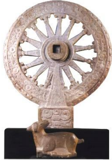
ภาพธรรมจักรกับกวางหมอบ