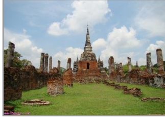
วัดพระศรีสรรเพชญ์