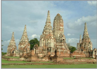
วัดราชบูรณะ