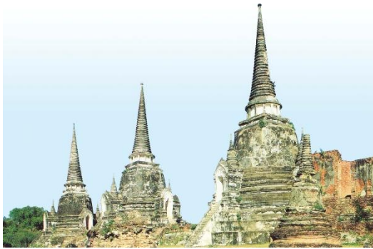
ภาพวัดพระศรีสรรเพชญ์ จ. พระนครศรีอยุธยา