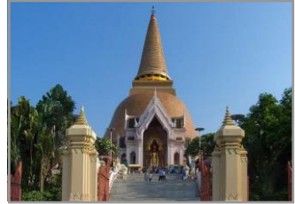
พระปฐมเจดีย์