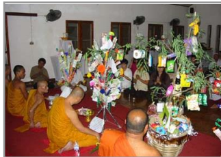
พิธีทอดผ้าป่า