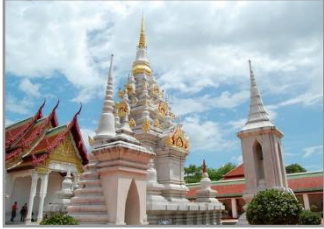
พระบรมธาตุไชยา