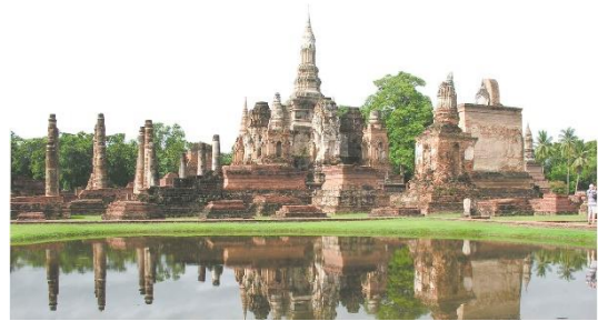
ภาพวัดมหาธาตุ จ. สุโขทัย