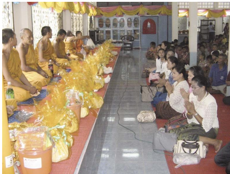
ภาพการถวายสังฆทานในวันสำคัญทางพระพุทธศาสนา

ที่มา : วิทย์ วิศทเวทย์ และเสฐียรพงษ์ วรรณปก. 2552. หนังสือเรียน รายวิชาพื้นฐาน พระพุทธศาสนา ม.1. พิมพ์ครั้งที่ 10. กรุงเทพมหานคร : อักษรเจริญทัศน์.