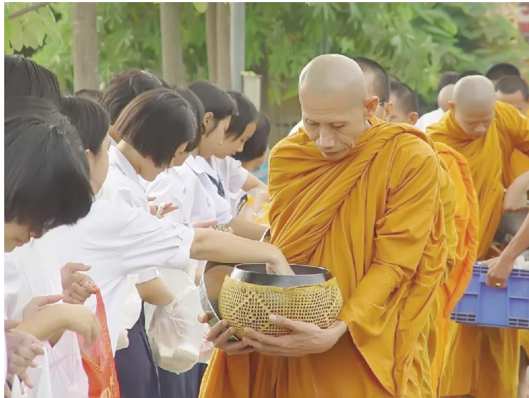
ภาพการทำบุญใส่บาตรในวันสำคัญทางพระพุทธศาสนา