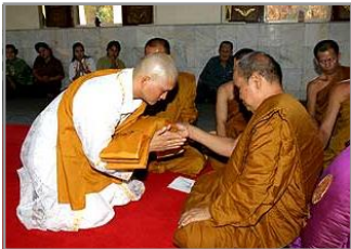
พิธีอุปสมบท