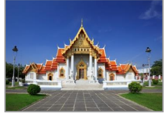
วัดเบญจมบพิตร