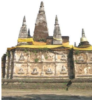
ภาพเจดีย์วัดเจ็ดยอด จ. เชียงใหม่