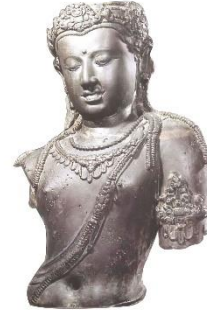
ภาพพระโพธิสัตว์อวโลกิเตศวรสำริด