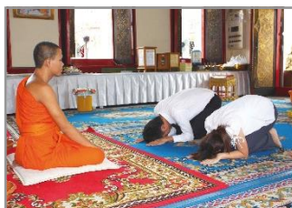
การกราบพระสงฆ์