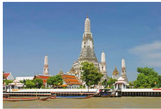
ภาพวัดอรุณราชวราราม กรุงเทพมหานคร

ที่มา : วิทย์ วิศเวทย์ และเสฐียรพงษ์ วรรณปก. 2552. หนังสือเรียน รายวิชาพื้นฐาน พระพุทธศาสนา ม.1. พิมพ์ครั้งที่ 10. กรุงเทพมหานคร : อักษรเจริญทัศน์.