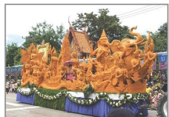
ประเพณีแห่เทียนพรรษา