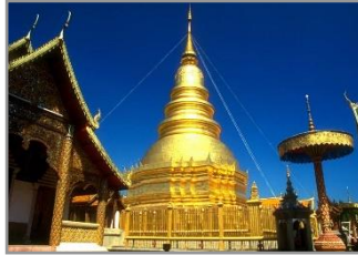
พระธาตุดอยสุเทพ