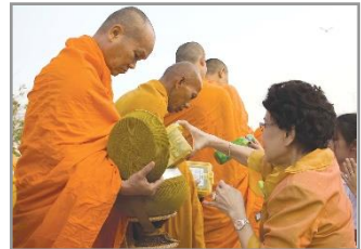
การทำบุญตักบาตร