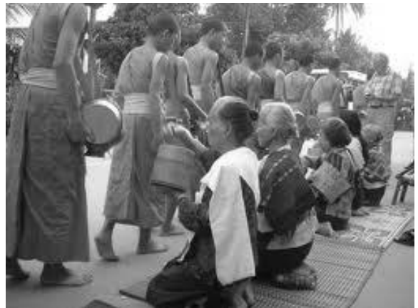
ภาพตักบาตรข้าวเหนียว