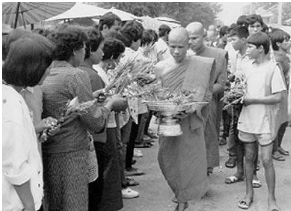
ภาพตักบาตรดอกไม้