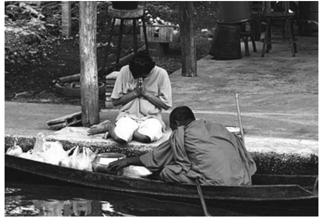
ภาพตักบาตรตอนเช้า