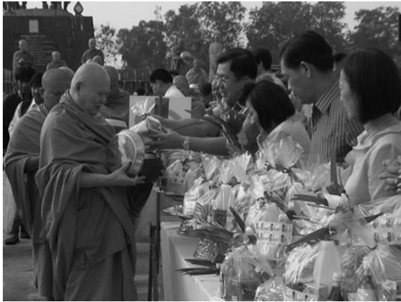
ภาพตักบาตรวันขึ้นปีใหม่