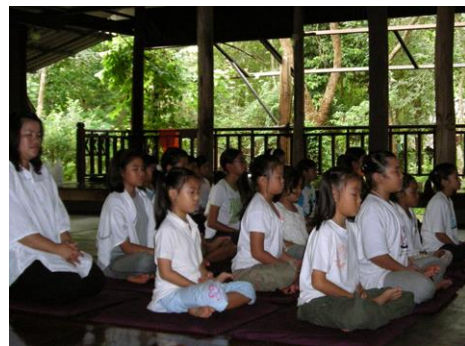
ภาพการนั่งสมาธิ