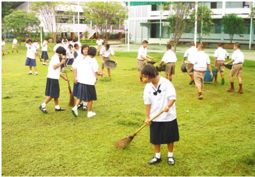
ภาพนักเรียนช่วยกันปรับปรุงภูมิทัศน์ บริเวณสนามโรงเรียน