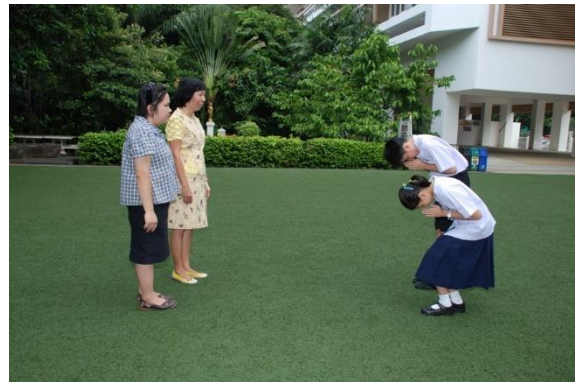
ภาพการไหว้ผู้ใหญ่