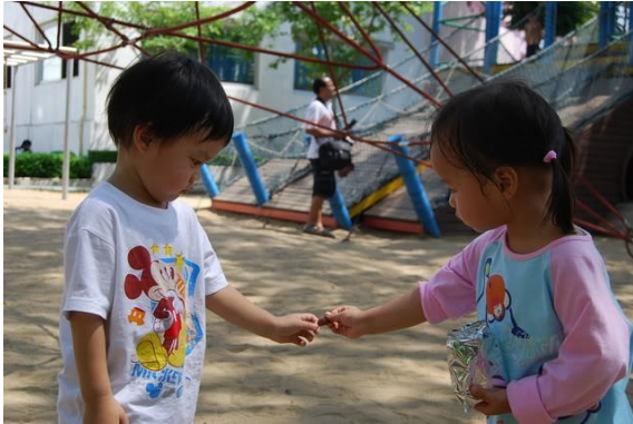
ภาพเด็กแบ่งขนมให้เพื่อน