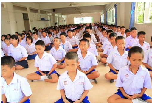
ภาพการนั่งสมาธิ