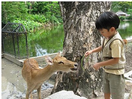
ภาพการให้อาหารสัตว์