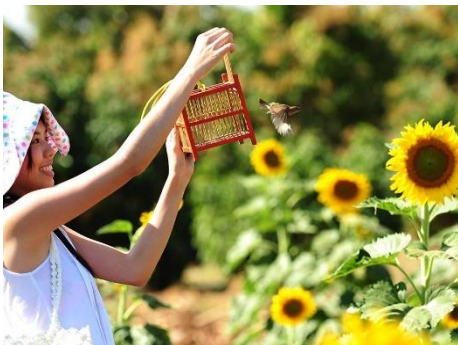
ภาพการปล่อยนก