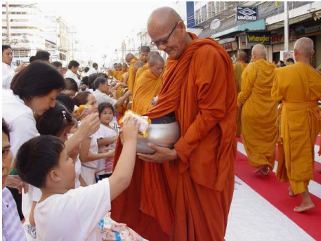
ภาพการทำบุญตักบาตร