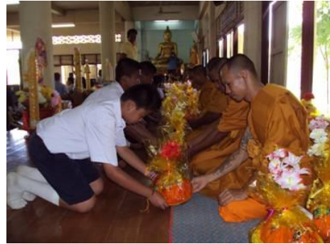
ภาพการถวายสังฆทาน