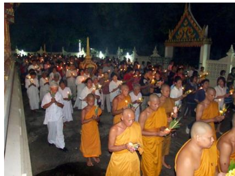
ภาพการเวียนเทียน