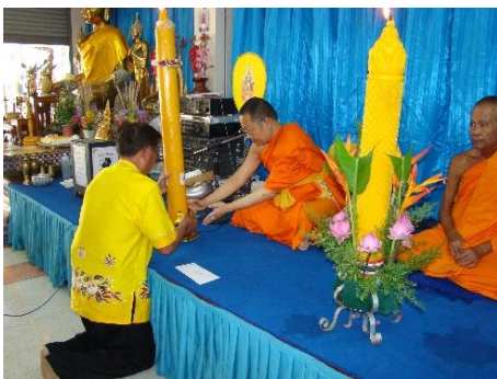
ภาพการถวายเทียนพรรษา