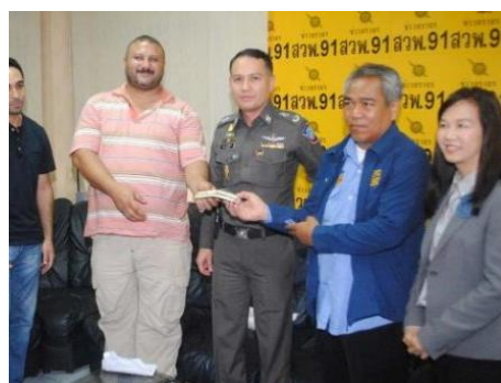
ภาพคนขับรถแท็กซี่เก็บเงินส่งคืนเจ้าของ