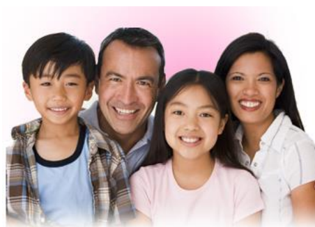
ภาพความพอใจและยินดีในคู่ครองของตน