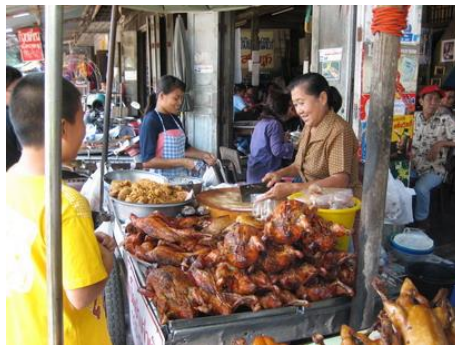
ภาพการประกอบอาชีพสุจริต